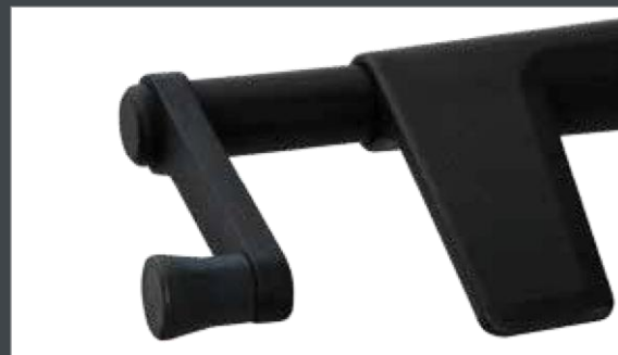
Mécanisme basculant avec adaptation individuelle au poids (résistance au basculement réglable par manivelle), permettant une position assise active et passive