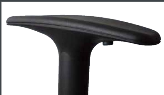
Accoudoirs réglables en hauteur sur 9 positions, orientables sur 3 positions