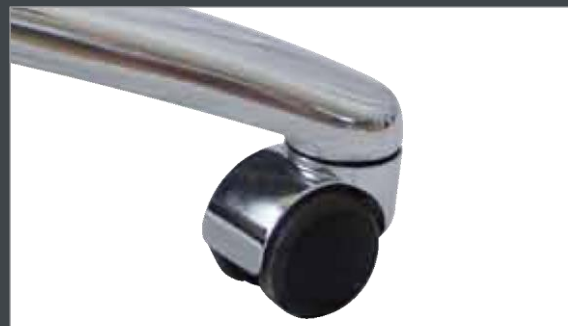
Roulettes chromées pour sols durs

Les sièges sont garantis 2 ans, ils sont disponibles chez les distributeurs agréés RECARO.