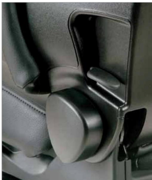
Réglage bilatéral du dossier