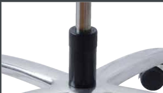
Piètement avec vérin pneumatique très robuste et puissant pour un réglage en hauteur progressif et une stabilité optimale