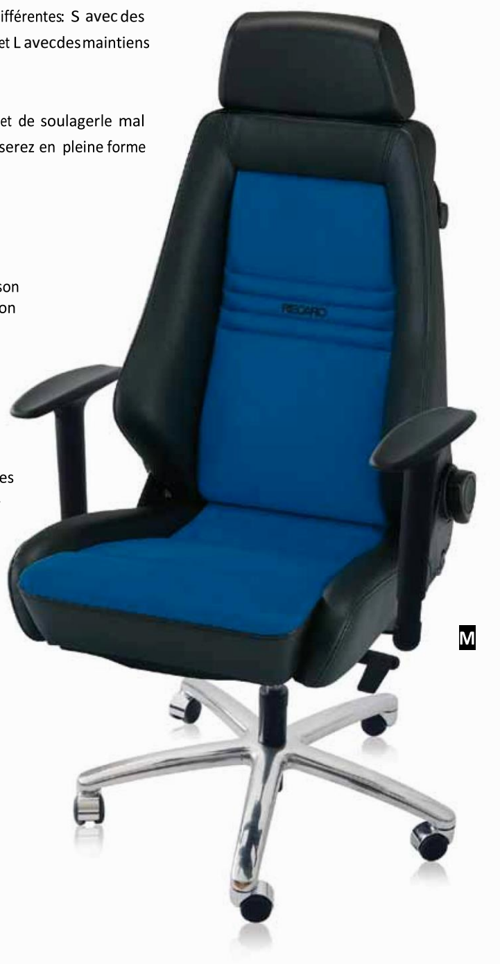
Assises S et L.