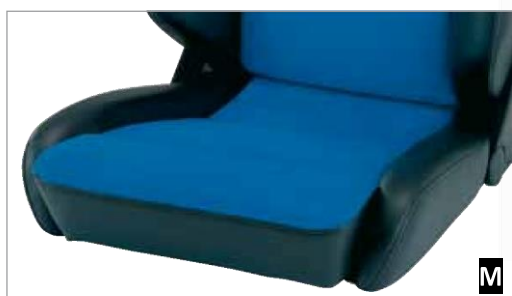
Assises S et M.